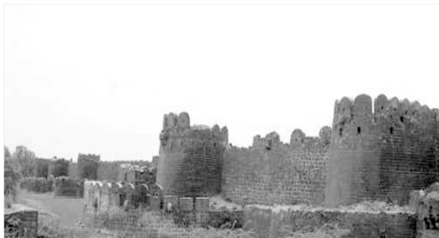
سبک معماری گلبرگه: قلعه‌ای در گلبرگه با سبک معماری بیدر.