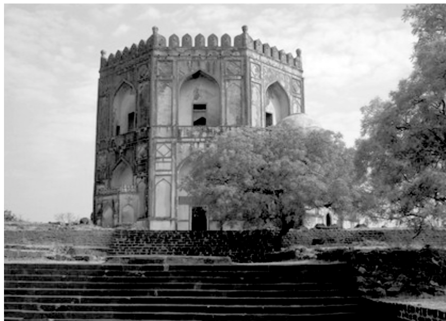
چوکندی (مقبره) خلیل الله.