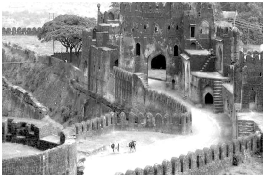
بالا: قلعه‌ای در بیدر؛ پایین: مقبره فیروزشاه.

هنر و معماری بناهای بیدر، شیوه‌های متفاوت خوشنویسی در آنها و همچنین طرح‌های گلدار و کاشی‌کاری‌های به‌کاررفته در آنها همه نشان از این دارند که تعداد زیادی صنعتگر، معمار، خوش‌نویس و کاشی‌کار از خاورمیانه، ایران و آسیای مرکزی در این منطقه فعالیت می‌کردند.